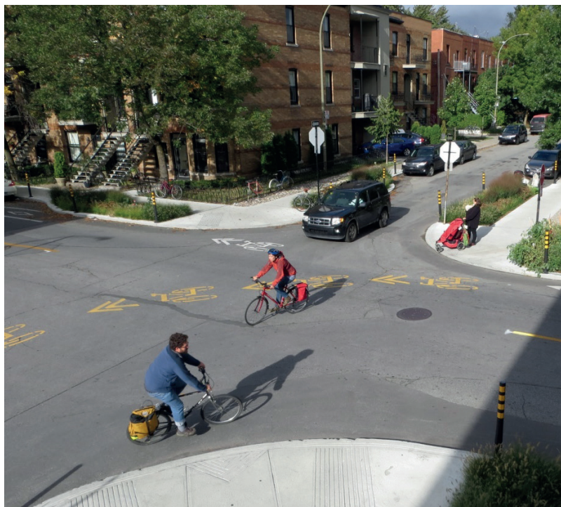
Rue Villeneuve et avenue de l'Esplanade, Montréal.

Pour assurer la sécurité et le confort de la traversée de la rue par les piétons, les aménagements fournis doivent être praticables en tout temps. Le déneigement, le déglçage et le drainage des intersections sont donc également très importants, tout comme la sécurisation des abords des chantiers de construction si ces derniers empiètent dans une intersection ou un passage pour piétons.