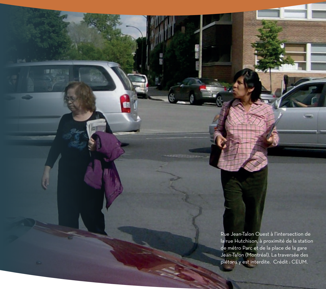
Rue Jean-Talon Ouest à l'intersection de la rue Hutchison, à proximité de la station de métro Parc et de la place de la gare Jean-Talon (Montréal). La traversée des piétons y est interdite.

Favoriser la mobilité active en milieu urbain est une excellente stratégie de développement durable et de santé publique. Encore faut-il que les déplacements des usagers vulnérables puissent se faire dans un cadre sécuritaire. Pour les piétons et les cyclistes, les principaux risques d'accidents surviennent lors de la traversée de la rue, au moment où ils sont exposés à la circulation motorisée. Bien plus que les facteurs comportementaux, l'environnement bâti, c'est-à-dire la façon dont la rue est physiquement aménagée aux intersections, est déterminant pour la sécurité des piétons et des cyclistes.