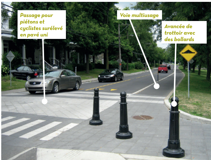
Chemin du Richelieu, Beloeil.